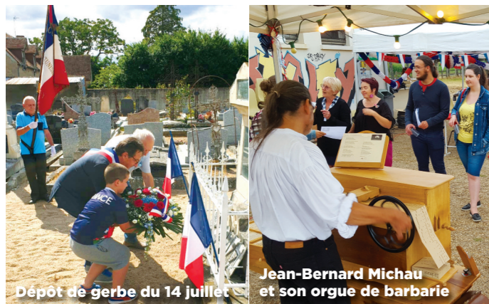
Dépôt de gerbe du 14 juillet et son orgue de barbarie

Les cérémonies du 14 juillet dernier ont été perturbées à cause du covid qui a empêché l'Harmonie de défiler, puis le feu d'artifice annulé au dernier moment pour cause de sécheresse et enfin, cerise sur le gâteau, un orage le soir empêchant la retraite aux flambeaux.