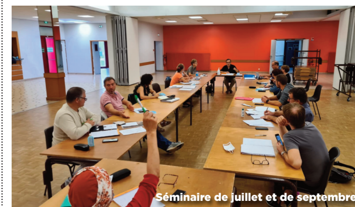
Séminaire de juillet et de septembre

L'équipe municipale s'est retrouvée à plusieurs reprises cet été pour travailler aux projets et préparer l'avenir.