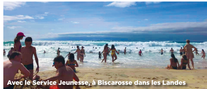
Avec le Service Jeunesse, à Biscarosse dans les Landes

Le programme d'activités proposé par le service jeunesse municipal pendant les vacances d'été est toujours attendu avec beaucoup d'impatience par les enfants et leurs parents.