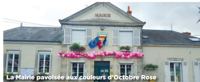
La Mairie pavoisée aux couleurs d'Octobre Rose

L'information sur le dépistage précoce permet de sauver des milliers de vie. La campagne Octobre Rose est un rendez-vous de mobilisation nationale. Pour cette 27 ème campagne d'information sur le dépistage précoce et la lutte contre les cancers du sein, la Mairie de Darvoy répond « présente » !