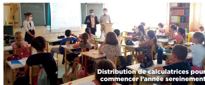
Distribution de calculatrices pour commencer l'année sereinement

La rentrée a été aussi préparée durant les vacances avec des travaux et l'installation d'une nouvelle salle de classe en réponse à l'ouverture annoncée en juillet. Les services techniques ont entretenu les locaux et installé de nouveaux outils (deux vidéo-projecteurs notamment). La municipalité travaille en étroite collaboration avec l'équipe enseignante afin de faciliter la rentrée dans le respect du protocole sanitaire.