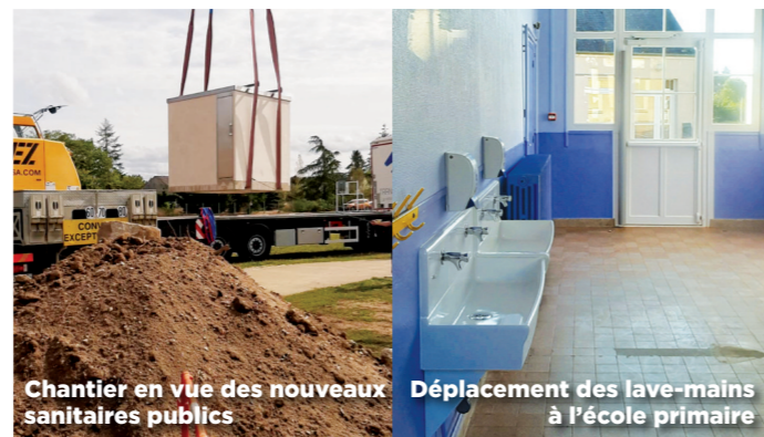
Chantier en vue des nouveaux sanitaires publics