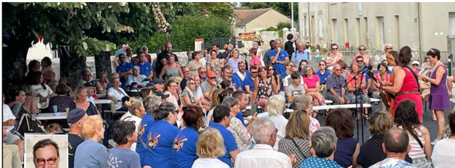
Grande fête du 14 juillet, avec Mademoiselle Orchestra.