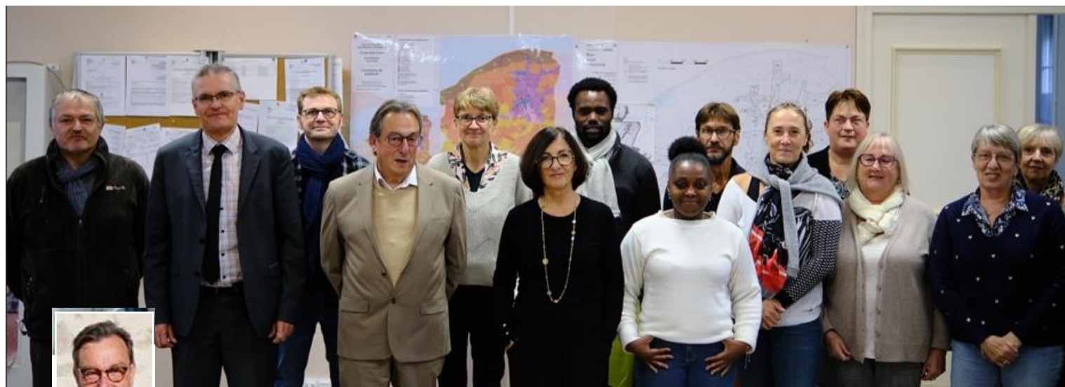
Visite de Madame la préfète de région, Sophie Brocas avec Monsieur le sous-préfet d'Orléans.