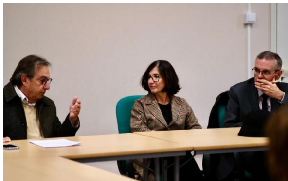
Séance de travail en mairie avec Madame la Préfète le 23/09.